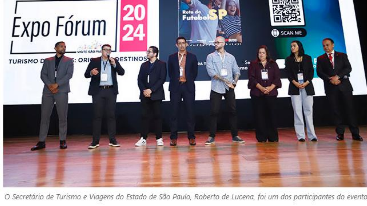
O Secretário de Turismo e Viagens do Estado de São Paulo, Roberto de Lucena, foi um dos participantes do evento

A terceira solução foi apresentada pela equipe HackChange com a solução RolezAI, que vai funcionar pelo whatsapp. Ao receber o contato e conversar com ela, o interessado cria um grupo com seus amigos. A inteligência artificial vai escolher o melhor local – restaurantes e eventos – de acordo com os interesses dos integrantes do grupo.