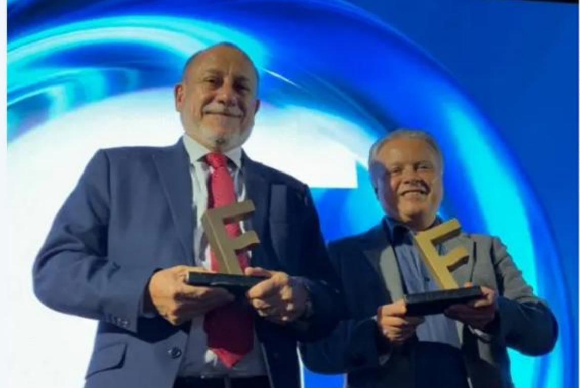
Abertura Festuris 36ª edição