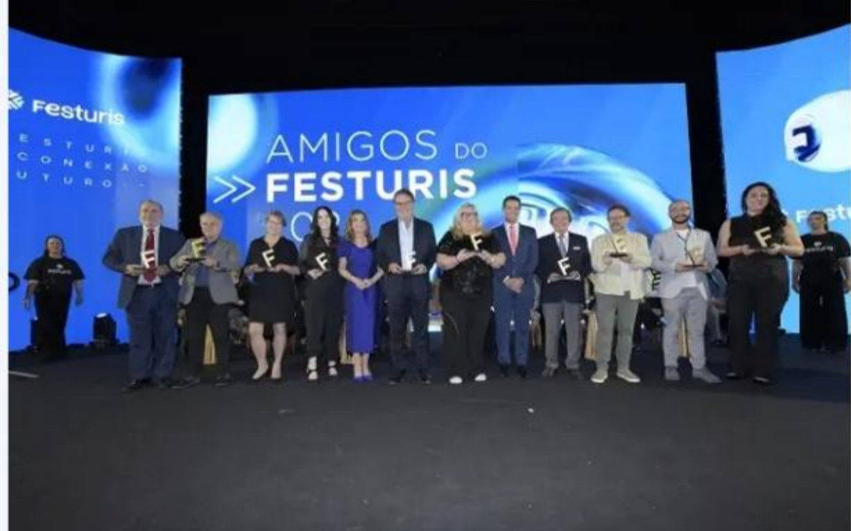
Homenagem Amigos do Festuris

Os Amigos do Festuris receberam troféus em reconhecimento ao apoio que sempre ofereceram ao evento. A gratidão do Festuris é um dos momentos mais tradicionais da solenidade de abertura.