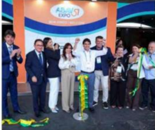
FEIRAS E EVENTOS 15 A 19

Itinerário combina aventura, descanso e uma imersão na cultura do Ceará. Páginas 10 e 11