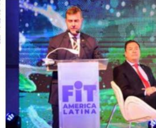
FEIRAS E EVENTOS 22 E 23

Entre os dias 26 a 28 de setembro, Brasília recebeu importantes figuras do turismo nacional e grandes players do trade no CICB. A edição de número 51 da Abav Expo atraiu um total de 23.439 visitantes.