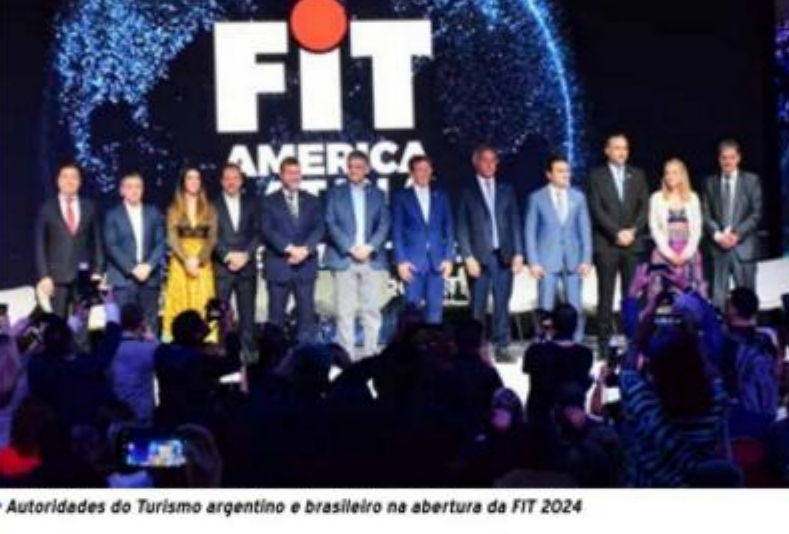
Autoridades do Turismo argentino e brasileiro na abertura da FIT 2024

Os primeiros dias da FIT foram abertos ao público, e os últimos, voltados para profissionais do setor. O ministro do Turismo, Celso Sabino, destacou a relevância do evento para a atração de turistas estrangeiros