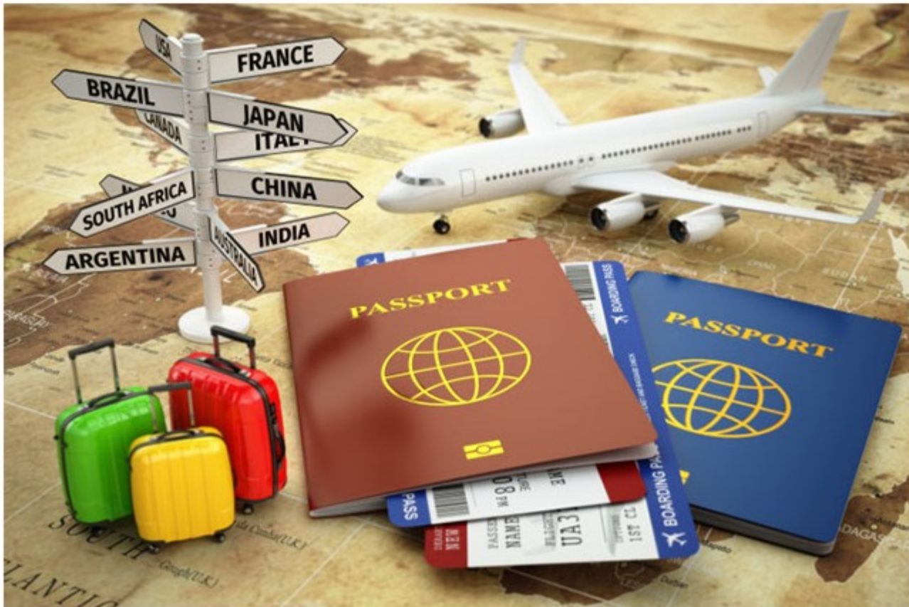
27 de setembro, Dia Mundial do Turismo

A reforma tributária no Brasil é um exemplo de como o turismo pode ser impactado por mudanças nas políticas econômicas. O setor precisa ser reconhecido por sua capacidade de gerar emprego e renda, e tratado como prioridade nas agendas de desenvolvimento econômico, com alíquotas competitivas. Países com IVA reduzido para o turismo mantêm sua competitividade, atraindo visitantes e incentivando a economia.